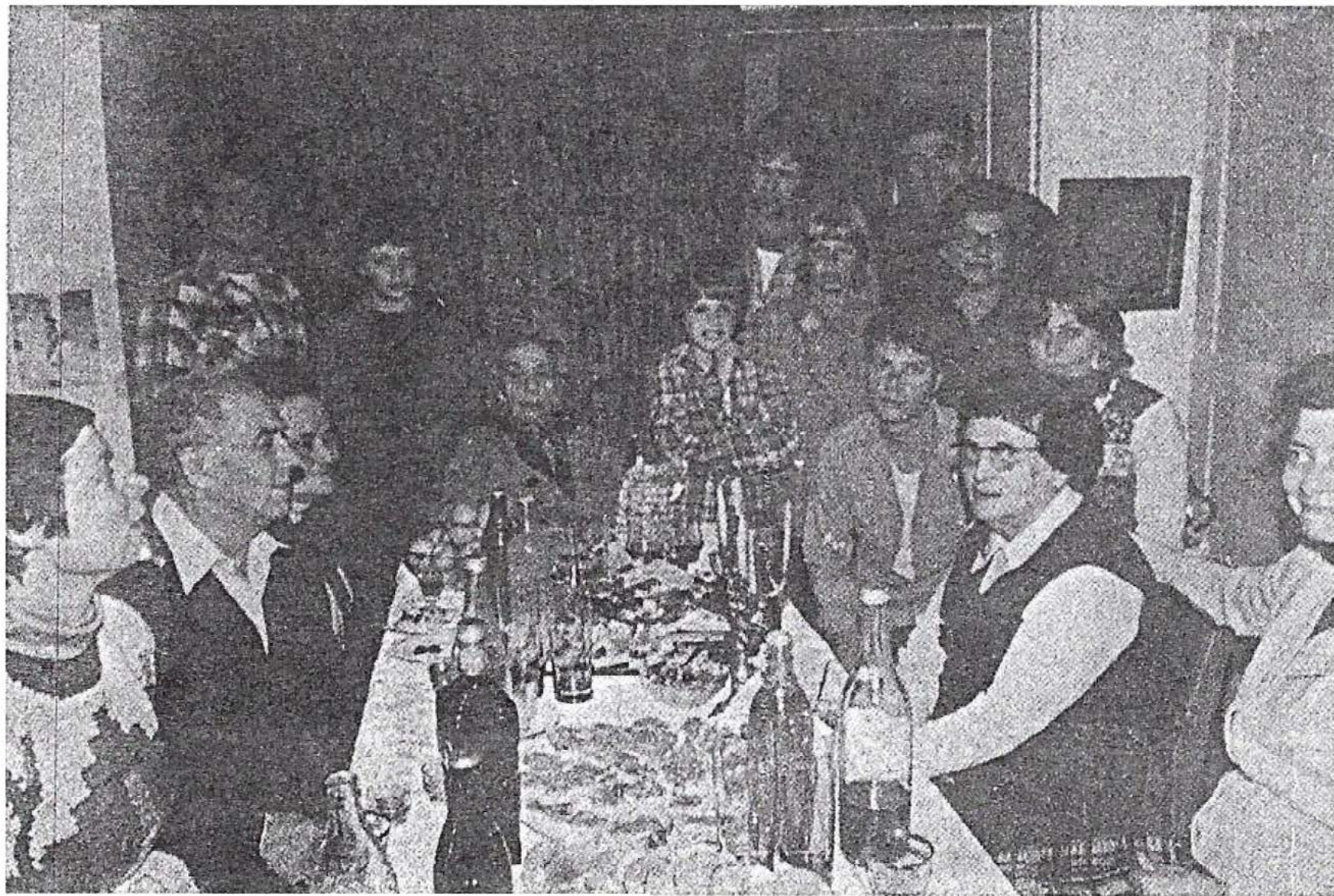
ארבעה דורות, נעז, חנוכה תש"ם