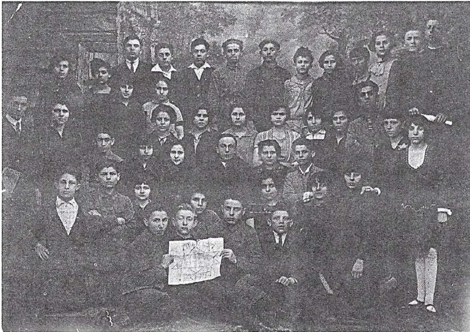
סניף "החלוץ-הצעיר", 1929