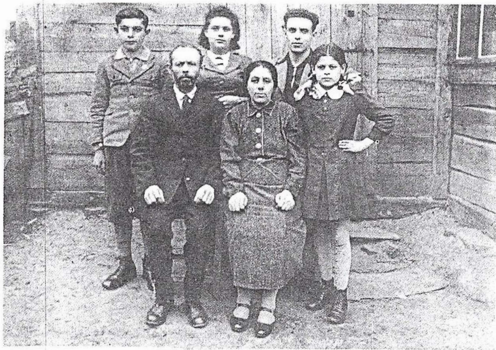
המשפחה, ליד הבית, 1939