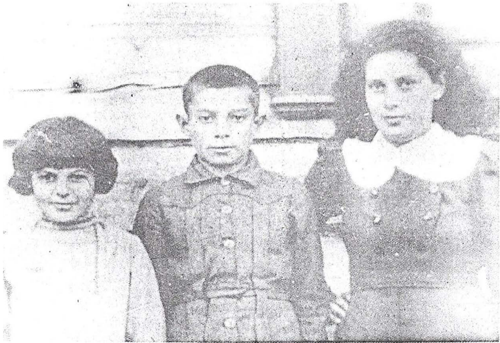
טליבל, אהרן-שמראל, פליגל, ניספור בשואה